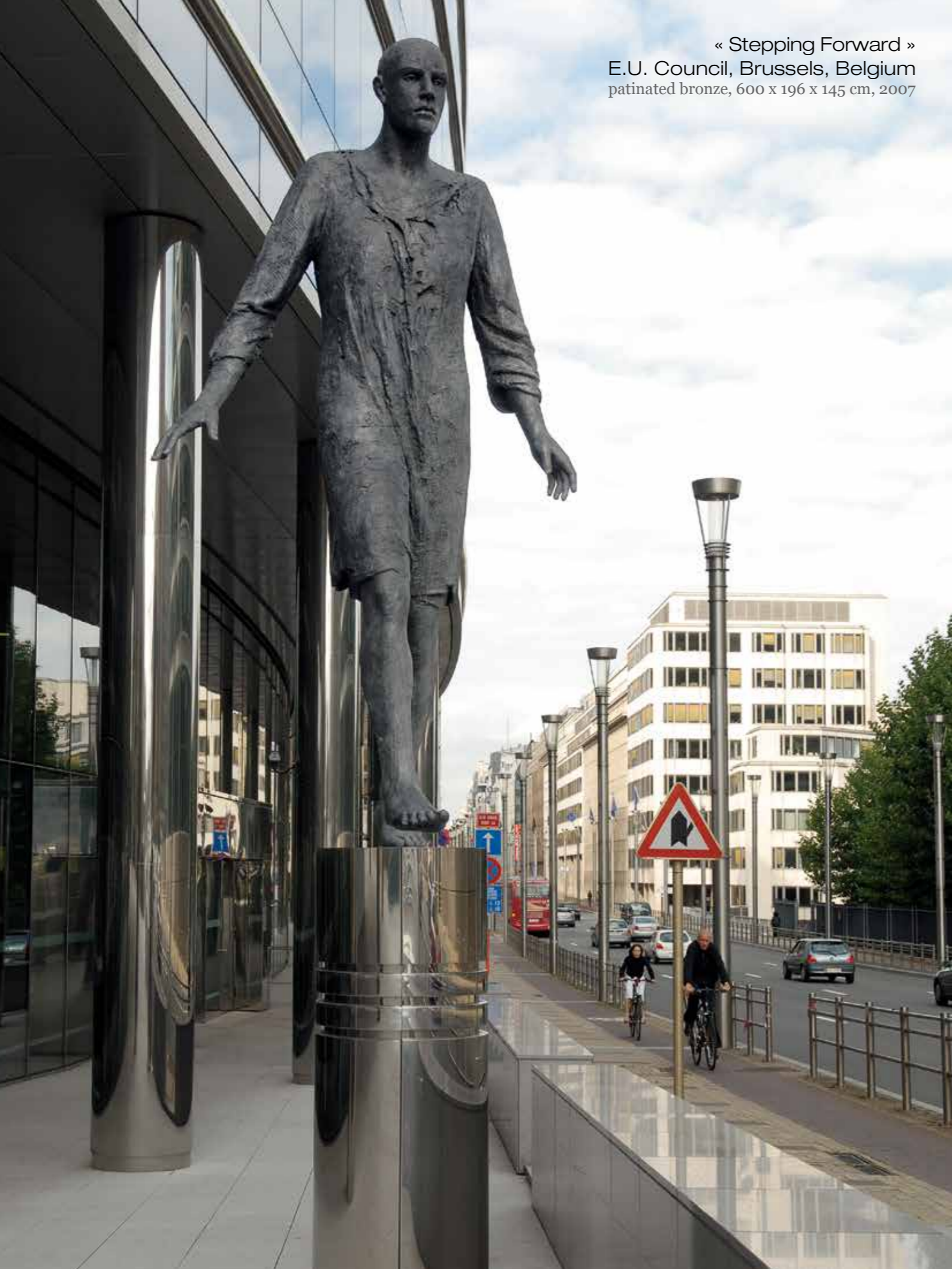
« Stepping Forward » E.U. Council, Brussels, Belgium patinated bronze, 600 x 196 x 145 cm, 2007