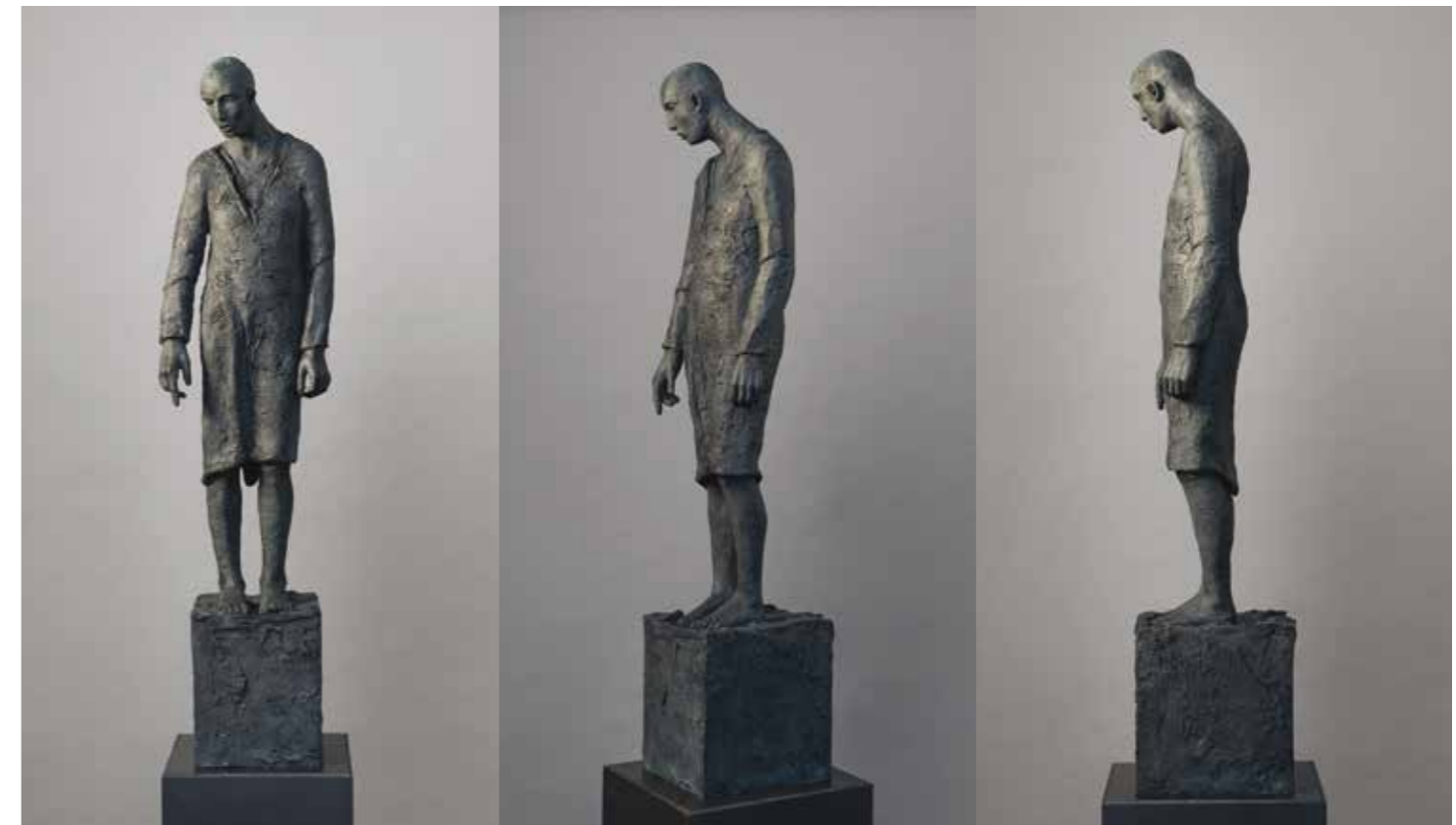
« Untitled », patinated bronze #119 ed. of 8, 97 x 24 x 20 cm, 2014