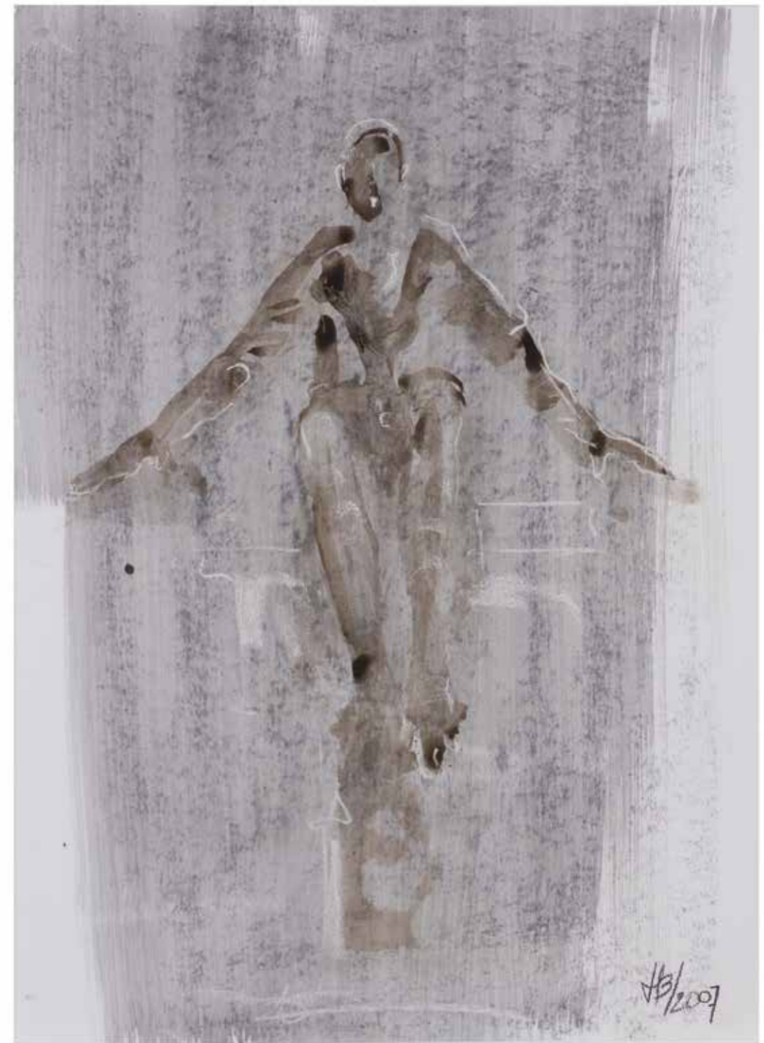
« Study of Searching for Balance », drawing #121 unique, mixed media on paper, 75 x 55 cm, 2007