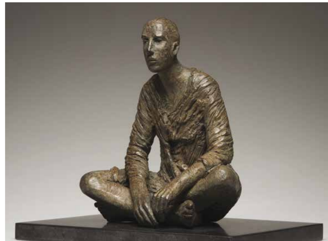
« Untitled », patinated bronze #113 ed. of 25, patinated bronze, 25.5 x 21.5 x 16.5 cm, 2012