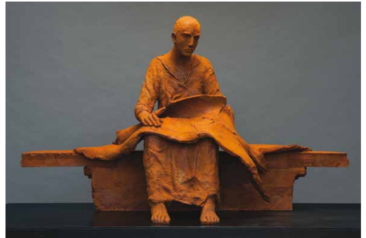
« Untilted », cast iron # 122 » ed. of 8, 69 x 115 x 51 cm , 2013