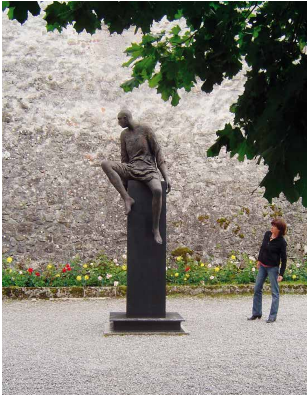
« L'Ennui » patinated bronze # 73 on steel base ed. of 7, 300 x 95 x 106 cm, 2007