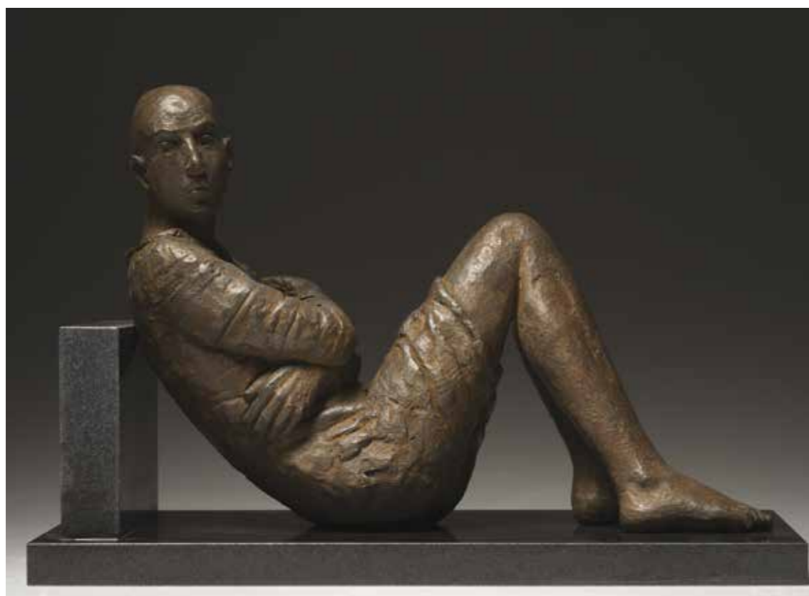
« Untitled », patinated bronze #115 ed. of 8, 24.5 x 40 x 21 cm, 2012