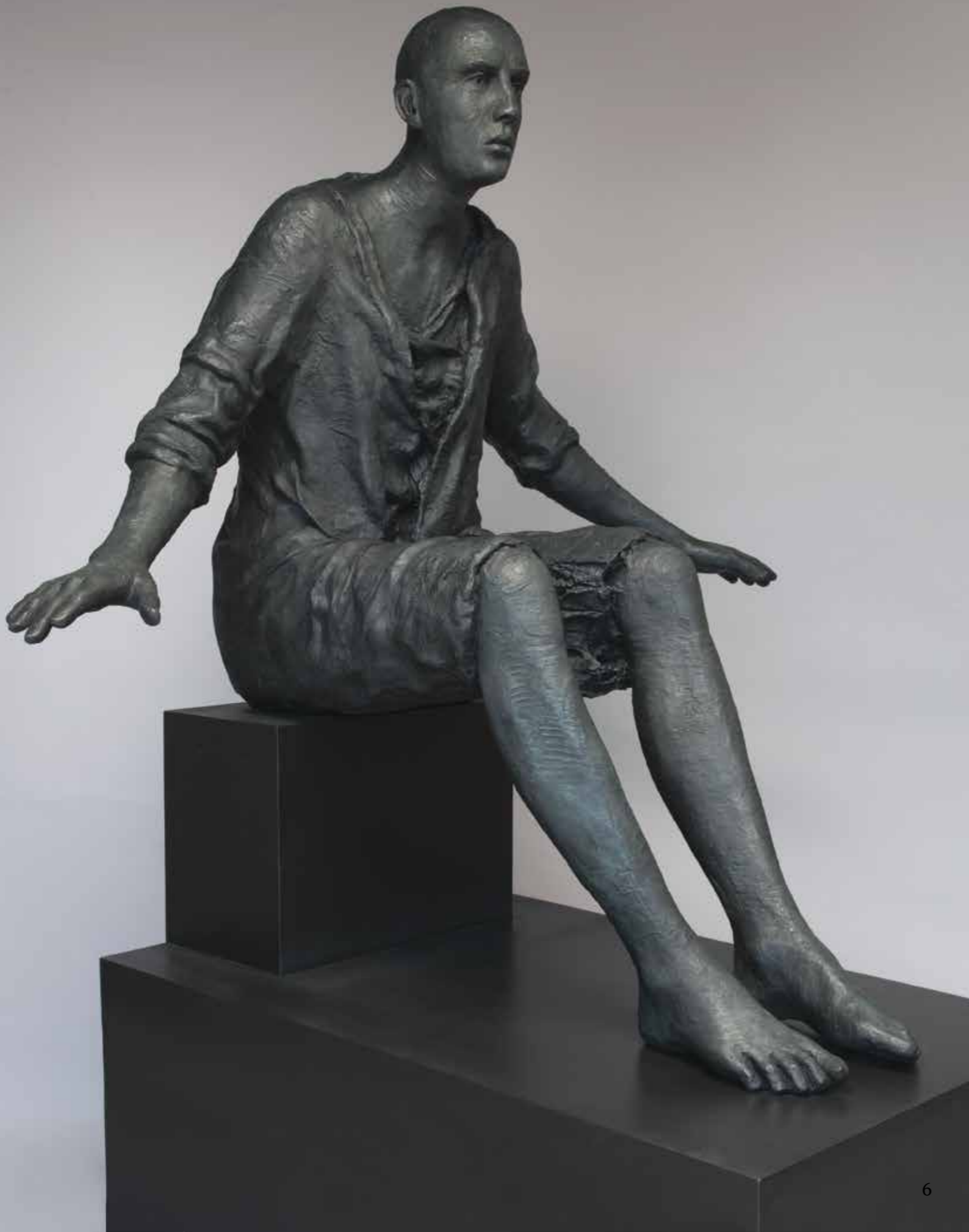
« Searching for Balance », patinated bronze #121 ed. of 6, 146 x 165 x 118 cm, 2014