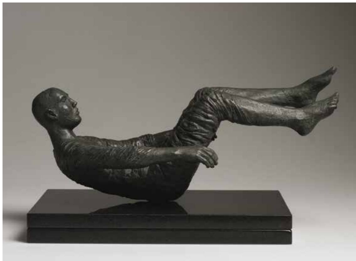
« Untitled », patinated bronze #100 ed. of 25, 17 x 44 x 20 cm, 2010