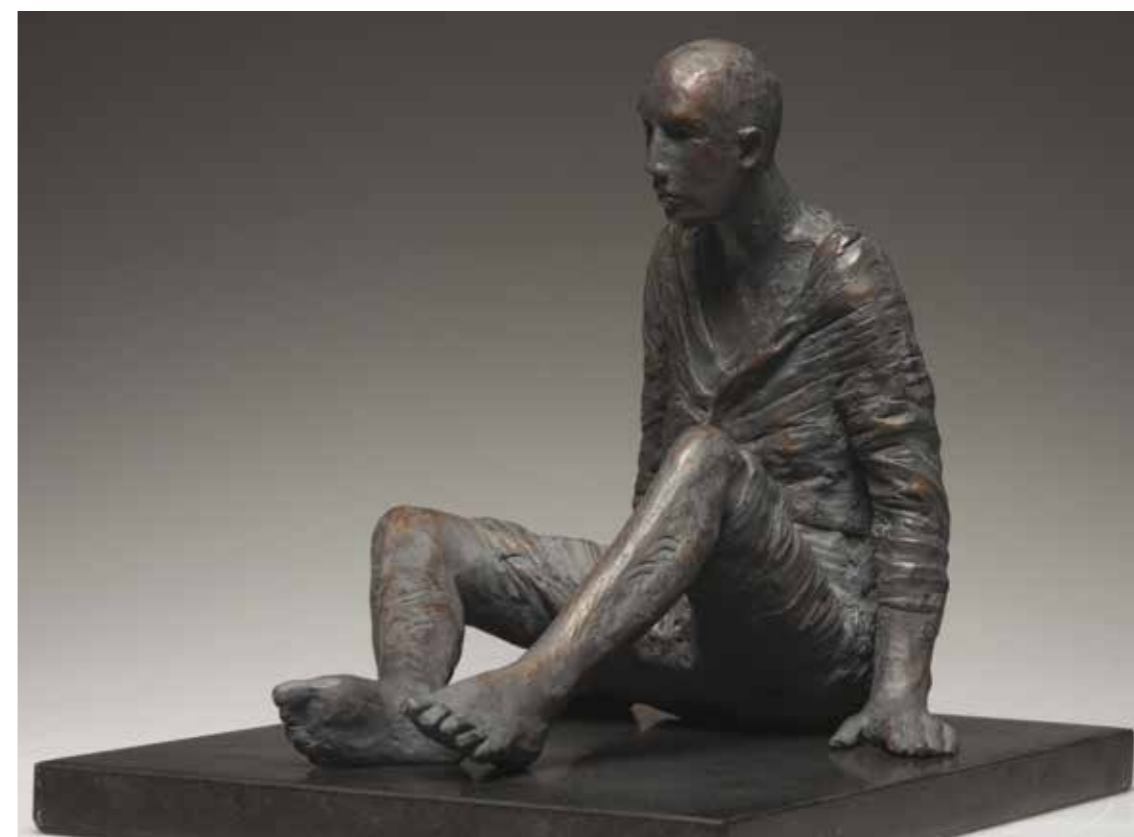
« Untitled », patinated bronze #114 ed. of 25, 23 x 19 x 27 cm, 2012