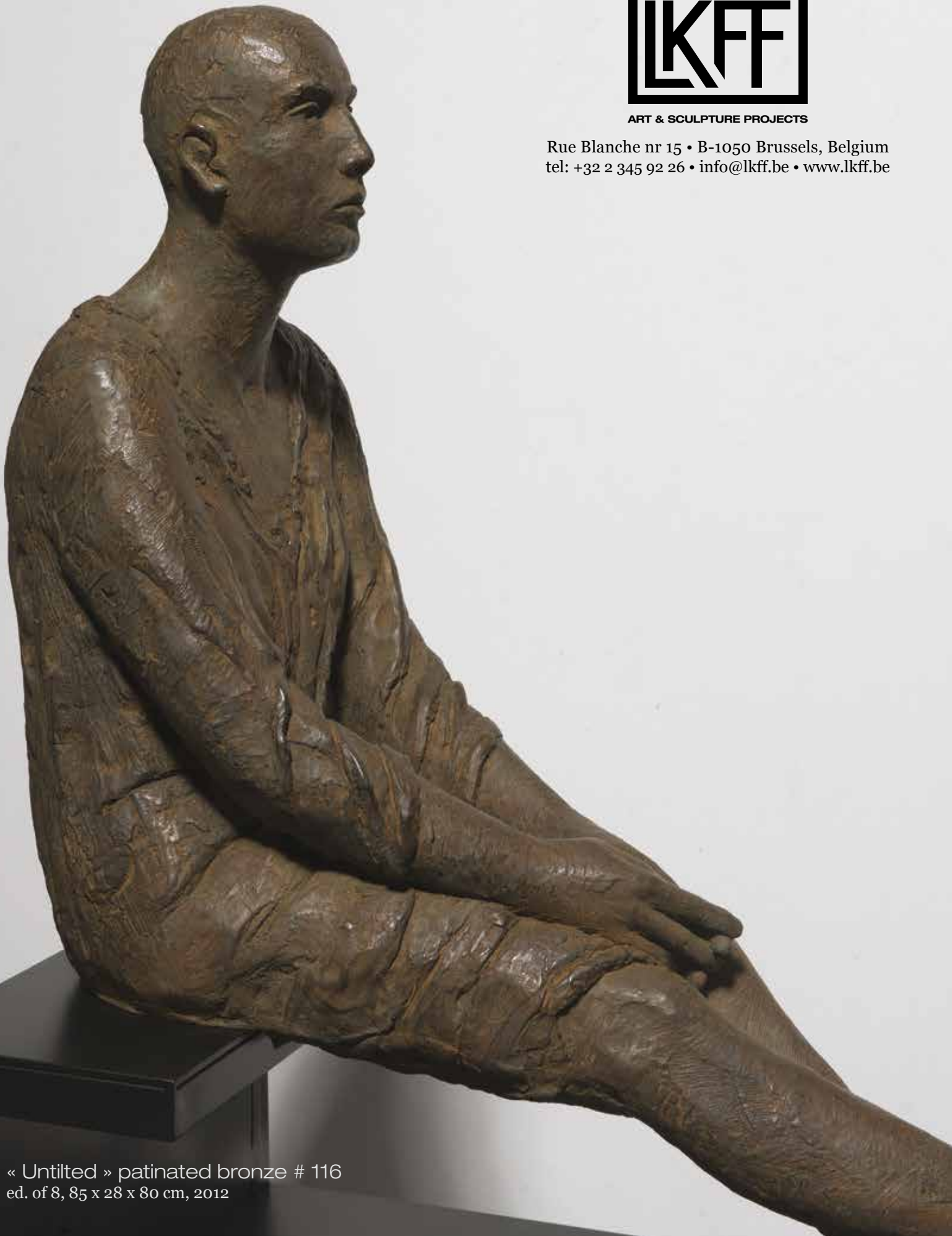
« Untitled » patinated bronze # 116 ed. of 8, 85 x 28 x 80 cm, 2012

Rue Blanche nr 15 • B-1050 Brussels, Belgium tel: +32 2 345 92 26 • info@lkff.be • www.lkff.be