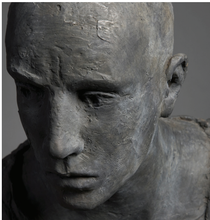
Hanneke Beaumont, bronze #99 (détail), 2010.

A découvrir à la galerie LKFF jusqu'au 31 octobre, 2011.