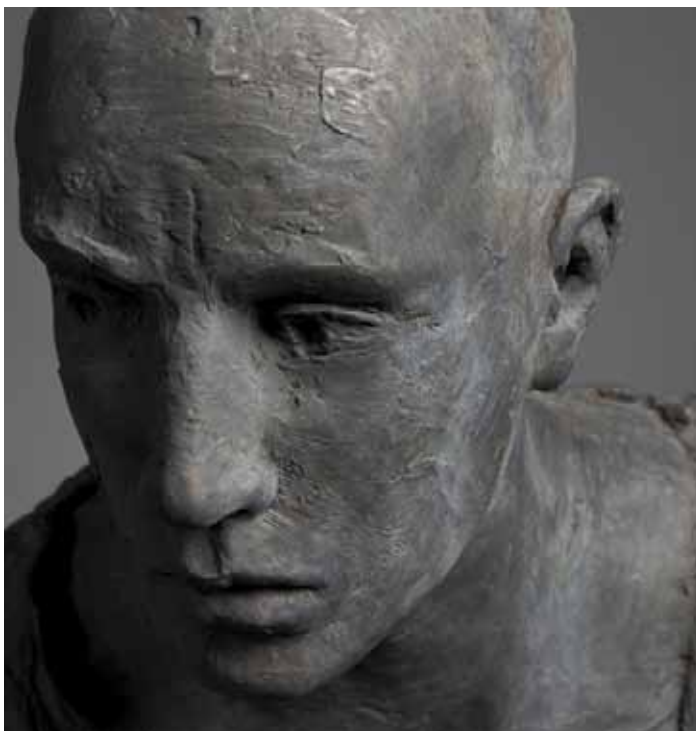
Hanneke Beaumont, bronze #99 (detail), 2010.

On view at the gallery until the 30 th of October, 2011.