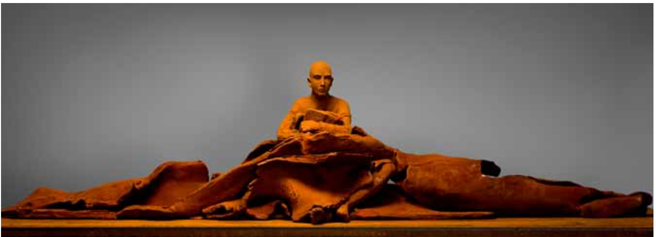
Hanneke Beaumont , «Abundance & Chaos», cast iron #96, 43 x 220 x 60 cm, ed. of 8, 2009.

«Who are we? What are we? Where are we going?». Man's perennial questions are echoed by Hanneke Beaumont's work, but she also raises more specifically contemporary issues as in her cast iron sculpture «Abundance & Chaos». Many of her figures appear neither male nor female, neither young nor old. They do not appear as portraits of particular individuals, nor are they modeled after idealized human forms. Physically, they are approximations of human beings, and as such, they provide a way to consider, from a distance, general ideas about the nature of the human race. Their positions are not aggressive or provocative, but neither are they resigned. Fragile but strong, motionless but ready to move, these figures, seem in a weightless spatial equilibrium - their human character tied to a string of thought. Dressed in timeless «clothes», partly structured material, intertwined with the body, they defy our perception without shocking our sensibility.