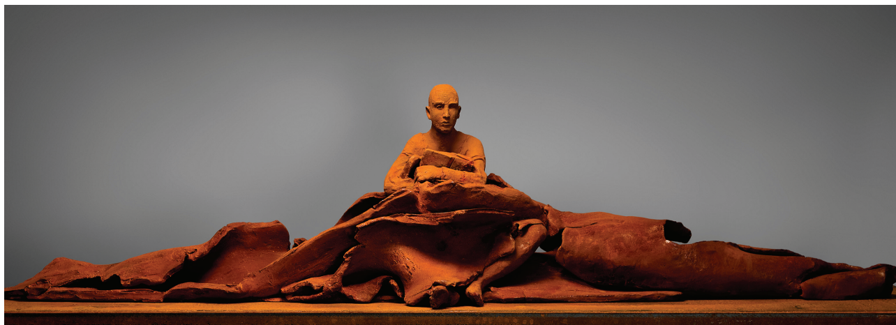
Hanneke Beaumont , « Abundance & Chaos » cast iron #96, 43 x 220 x 60 cm, ed. of 8, 2009

«Wie zij we? Wat zijn we? Waar gaan we naar toe?» Vragen, die de mens zich door de tijd heen steeds heeft gesteld, worden door Hanneke Beaumont als hedendaagse problematiek aan de orde gesteld zoals in het gietijzeren kunstwerk «Abundance and Chaos». Haar figuren lijken noch man, noch vrouw, noch jong noch oud. Ze zijn geen portretten, geen bepaalde individuen, niet gemodeleerd naar geïdealiseerde menselijke vorm. Fysiek lijken ze wel op mensen en als zodanig zetten ze ons aan na te denken over de aard van de mens in het algemeen. Hun houdingen provoceren niet, maar laten ons ook niet met rust. Kwetsbaar doch sterk, onbeweeglijk, maar klaar om in actie te komen, lijken deze figuren in een gewichtloos ruimtelijk evenwicht. Gekleed in tijdloze «kleding», vaag aangegeven door de structuur van het materiaal, dagen ze onze waarneming uit, en geven ons te denken.