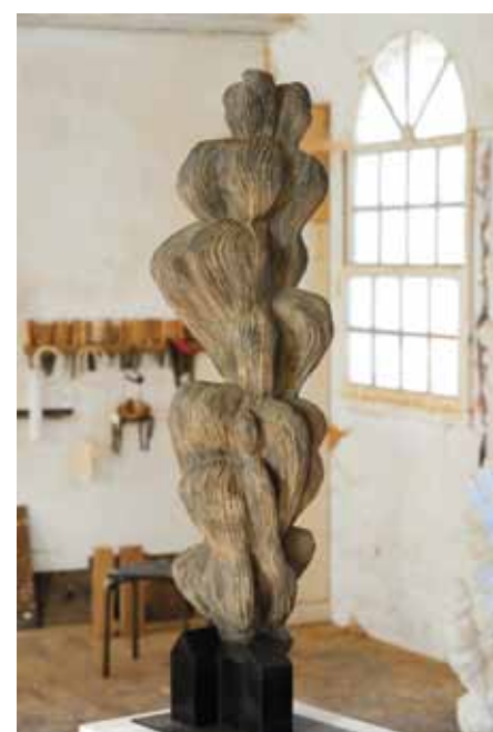
Maison et volutes, 2012, bronze, H. 110 cm.