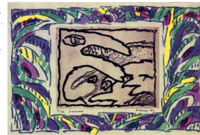
'De toutes parts', gemengde techniek. © Galerie Azur. Prijs: prenten van € 110 tot 650; originele werken vanaf € 5.000.

Galerie Triangle Bleu Cour de l'Abbaye 5 Stavelot www.trianglebleu.be t/m 06-10