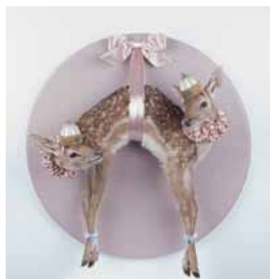
'Une Journée Ordinaire', taxidermie & gemengde techniek, 2012-2013. Prijs: € 2.500 tot 20.000.