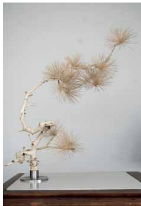
'Scattered Pine', Series No. 2, 2012, 105 x 80 x 106 cm. © Shi Jinsong/Feizi Gallery. Prijs: € 10.000 tot 40.000.

Feizi Gallery Abdijstraat 8b Brussel www.feizi-gallery.com 06-09 t/m 30-11