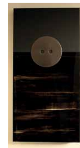
Transibérien, huile (laque), acrylique et aluminium sur sarcophage de bois stratifié, 120 x 60 x 3,5 cm.

Mathilde Hatzenberger Gallery Rue Haute 11 Bruxelles du 05-09 au 12-10 www.mathildehatzenberger.eu Prix : de 750 à 10.000 €