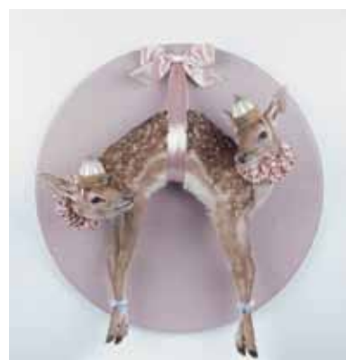
Une Journée Ordinaire, taxidermie & technique mixte, 2012-2013.