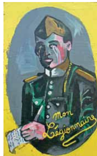
Manon Bara, Mon légionnaire, laque sur toile, 120 x 70 cm. © l'artiste et Rossicontemporary

Du côté de la Piazza de Rossicontemporary, une installation toute en sobriété de Patrick Carpentier. En juxtaposant des livres et des photographies, des petites sculptures ou des textes, l'artiste belge tente de donner une forme visuelle au 'Neutre'. Sa source d'inspiration ? Les leçons