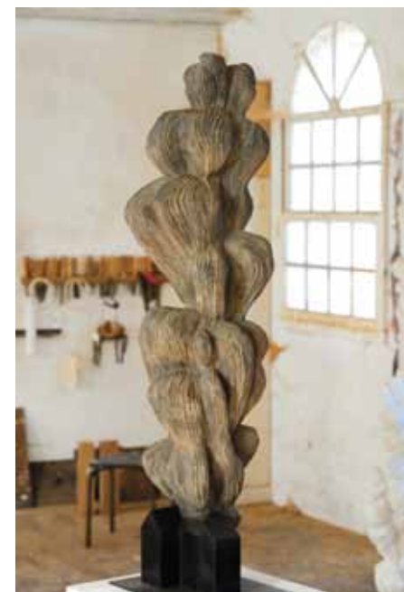
Maison et volutes', 2012, brons, 110 cm hoog. © Axel Cassel, Galerie Fred Lanzenberg. Prijs: schilderijen van € 3.000 tot 12.000; sculpturen van € 4.000 tot 25.000.

Axel Cassel heeft vele jaren rondgereisd, van Papoea-Nieuw-Guinea tot Nepal. Op die reizen heeft hij zich ondergedompeld in de lokale etnische kunsten en hun symbiose met de natuur ervaren. Hij maakte sculpturen vertrekkende