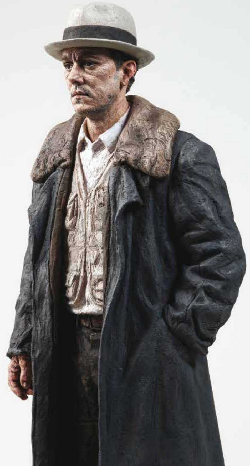
The Way it is, 2012 Bronze, oil paint 81 x 33 x 22 cm | Edition of 6