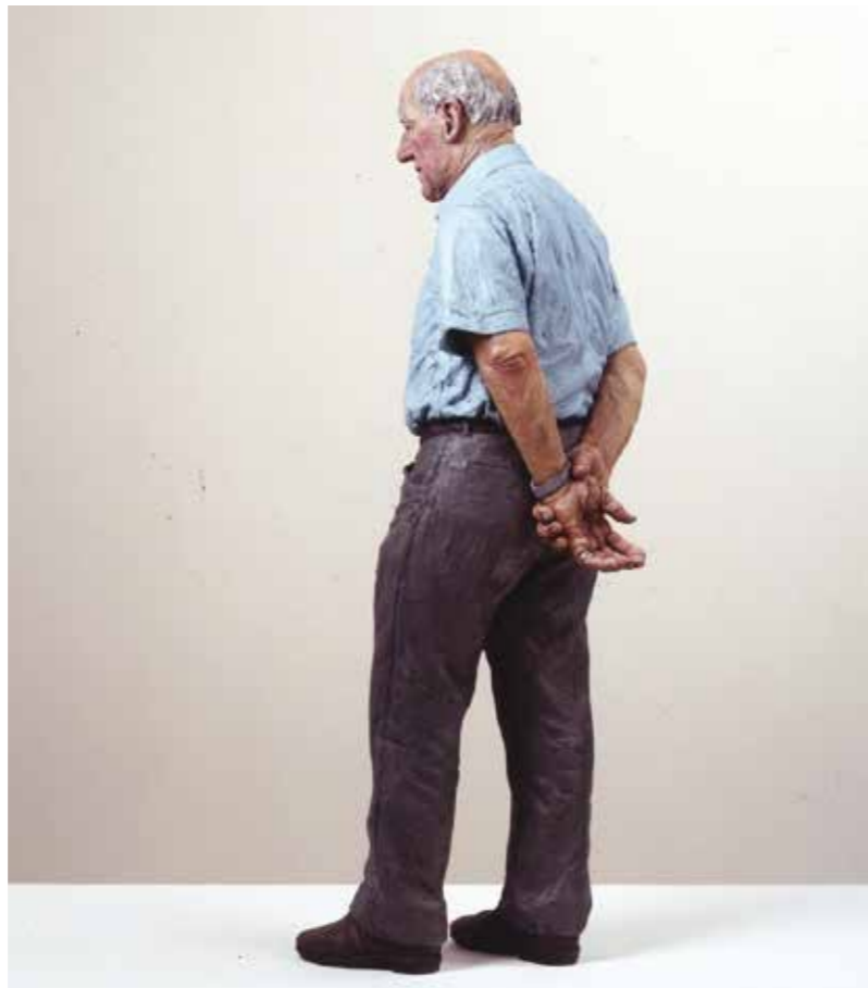
Standing Man, 2007 Bronze, oil paint 107 x 39 x 33 cm | Edition of 6