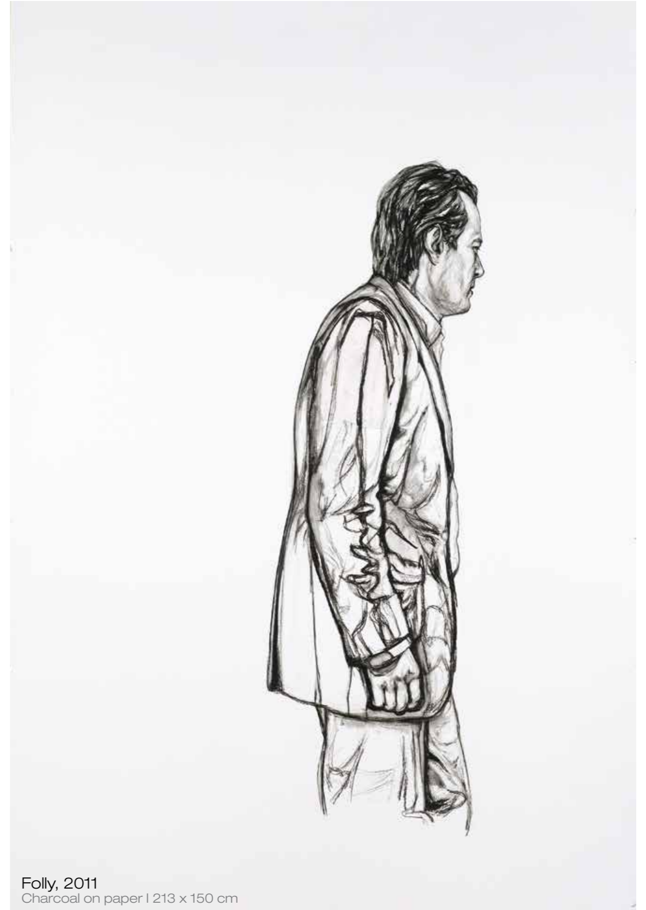
Folly, 2011 Charcoal on paper | 213 x 150 cm