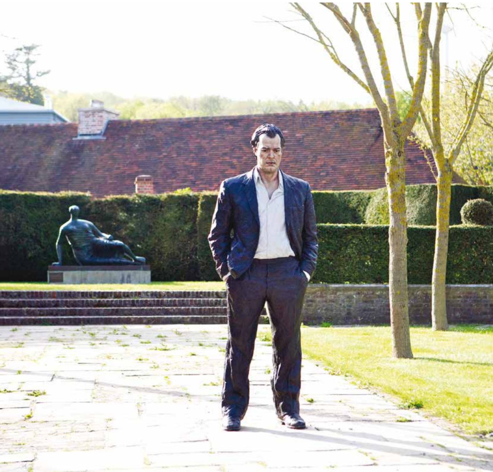
Standing Man, 2010 Bronze, all weather paint 201 x 74 x 49 cm | Edition of 4