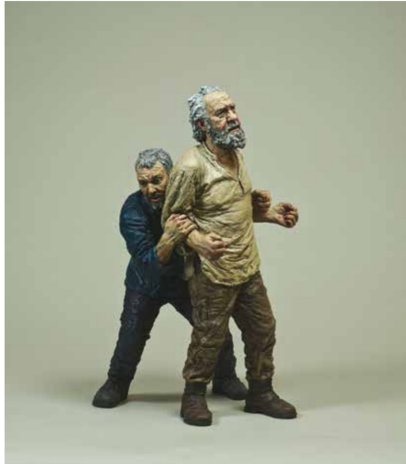
T.B.T.F., 2013 Bronze, oil paint 64 x 34 x 43 cm | Edition of 6