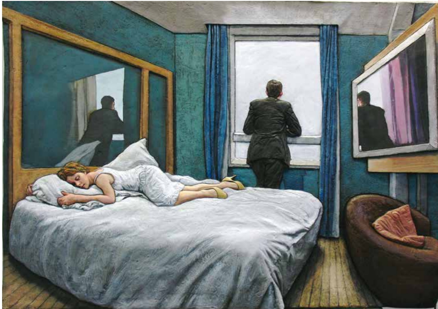
Hotel Room, 2005 Aluminium, oil paint, varnish, wax 140 x 97 x 10 cm | Edition of 2

« We are most innocently ourselves when we sleep » (Sean Henry)