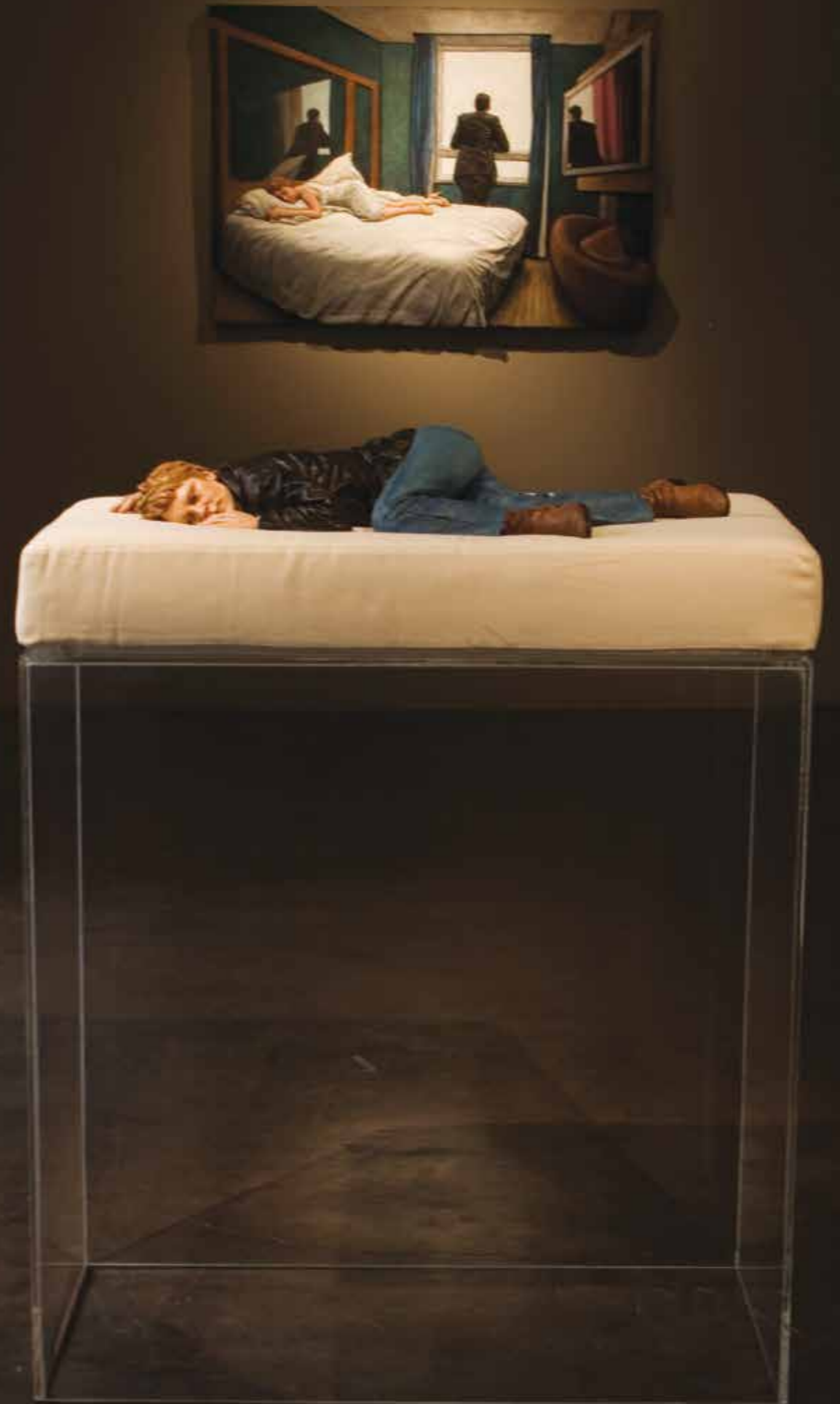
Lying Woman, 2005 Fired clay, oil paint, cushion, perspex 81 x 13 x 36 cm | Bronze edition of 6