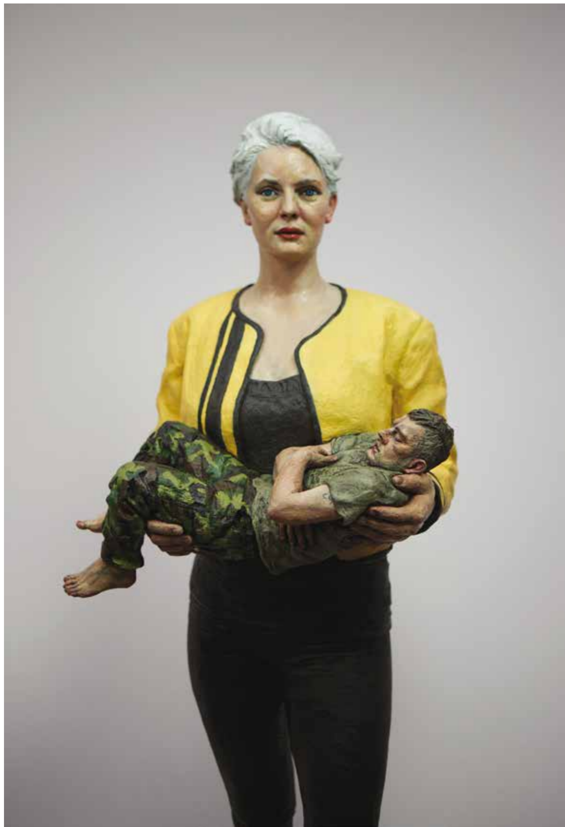
Sleeper, 2013 Bronze, oil paint, cast stone base Figure: 109 x 42 x 31 cm | Edition of 6