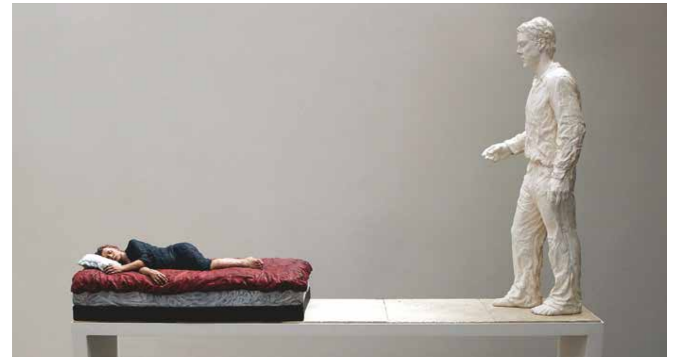
Ursula's Dream, 2001 Bronze, oil paint, steel, plaster travertine marble 202 x 140 x 41 cm | Edition of 5