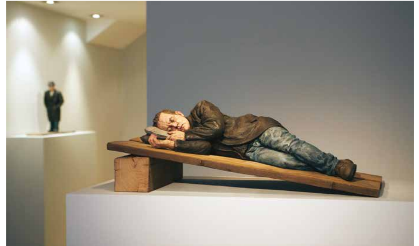
Ramp, 2012 Bronze, oil paint, wood 90 x 44 x 32 cm | Edition of 6