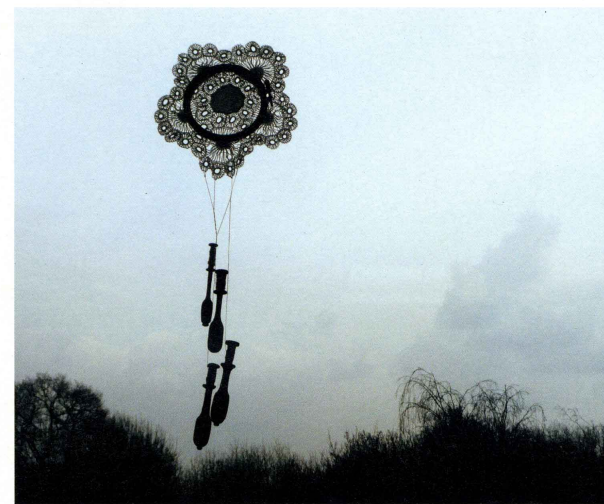
FLYING LACE, 2011, DENTELLE, FUSEAUX, TAMBOUR